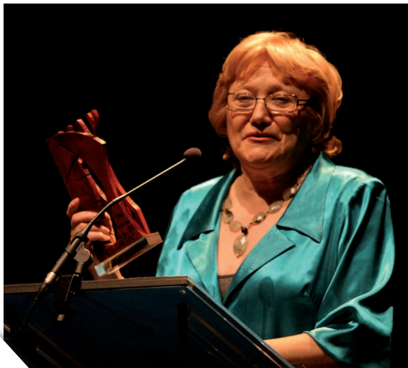
Rebut el premi Carmen Vidal a la Dona de l'Any el 2009