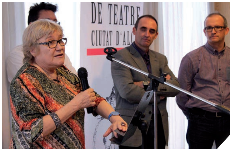
Rebut el premi de Teatre Ciutat d'Alcoi l'any 2011