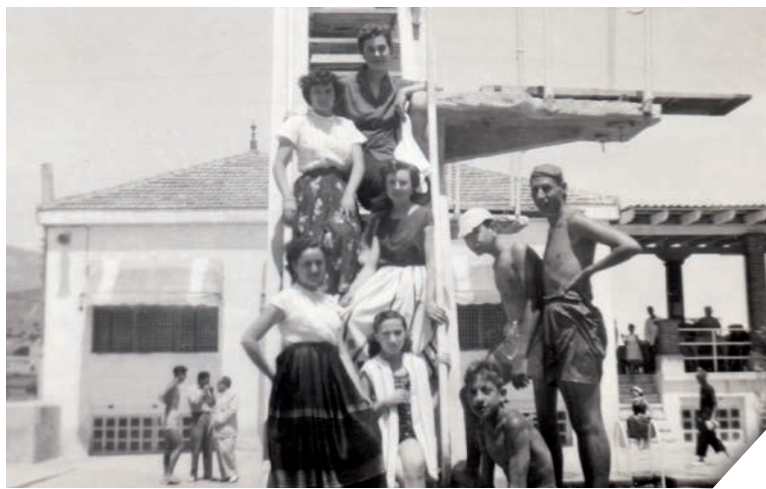
Al centre-baix, amb les treballadores de la perruqueria a la qual acudia la mare, un dia a la piscina municipal