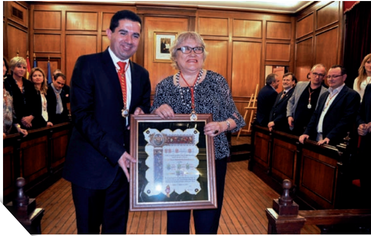
Amb l'alcalde d'Alcoi Toni Francés, rebent les distincions de Medalla d'Or i Filla Predilecta l'any 2013