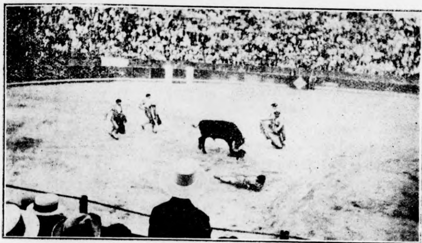
Cogida de Clásico al pasar de muleta a su primer toro en la corrida celebrada en nuestra plaza el día 27 de Junio