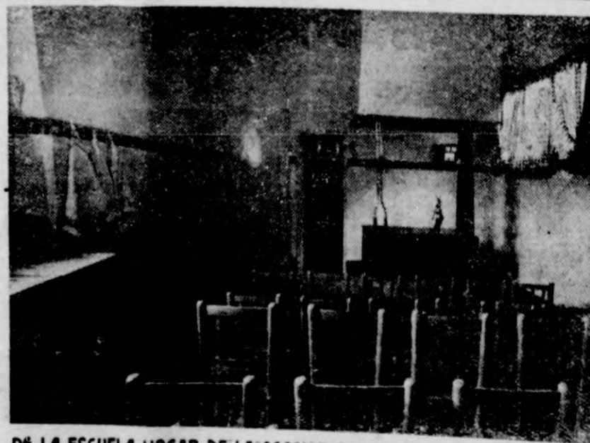
DE LA ESCUELA HOGAR DE LA SECCION FEMENINA. - La cocina y despensa, dispuesta para las clases.

La práctica de la caridad enorgullece al hombre y tú puedes practicarla, ofreciendo un donativo para la fiesta de Reyes.