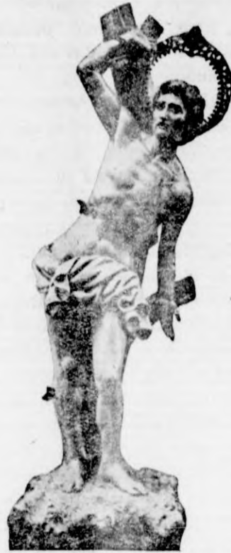
Nueva imagen de San Sebastián, segundo Titular de la Parroquia de San Roque, bendecida el domingo día 16 del actual.

Es posible que las circunstancias me hayan deparado la suerte de presenciar el mejor partido que