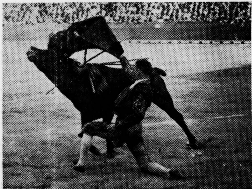
Serrans en un pase de rotillas

Gran surtido en camisas, corbatas, sombrillas y en todo el ramo de bisutería y Paquetería