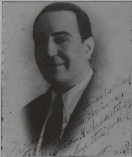
Nuestro paisano afincado en Caracas (Venezuela) 1948.