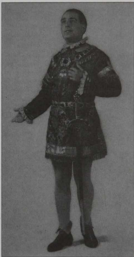
Interpretando a "El duque de Mantua" de la Ópera "Rigoletto" (1931).

La Compañía de los Gorgé, compuesta por un formidable elenco de valencianos, actúa en tierras de Argentina, concretamente en Buenos Aires, donde llevan a escena el género lírico español. El Teatro Colón abría las puertas a los artistas de la madre patria.