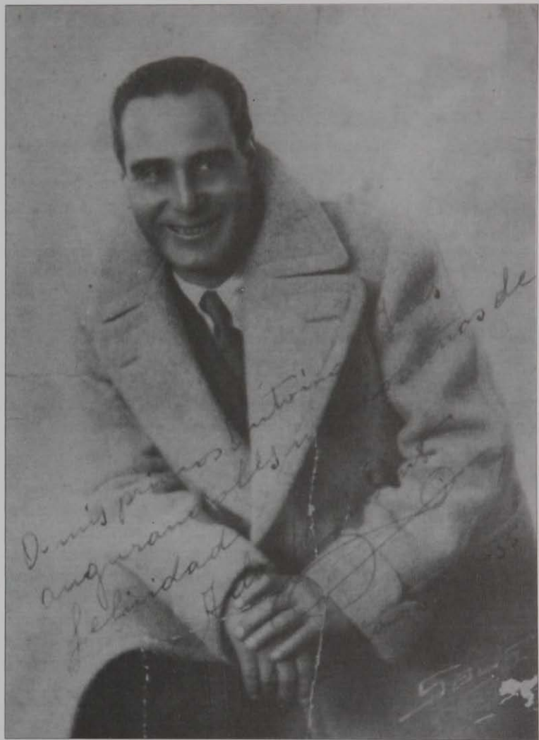
Retrospectiva de Adolfo Sirvent, 1935.