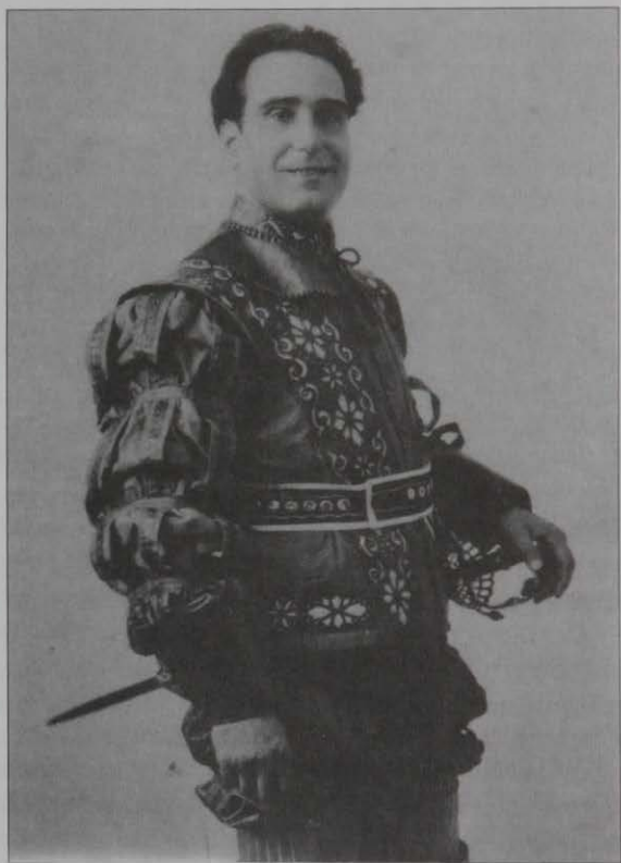
Una nueva versión del aplaudido rol de "Rigoletto".