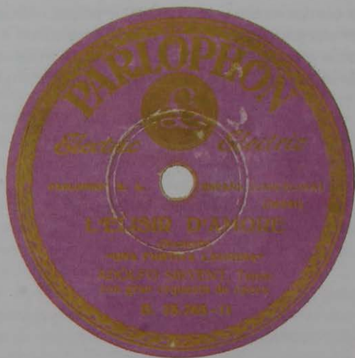
Carátula central de un disco gramofónico impresionado por Adolfo Sirvent en 78r.p.m., para la firma comercial "Parlophon" de Barcelona (Febrero 1929).