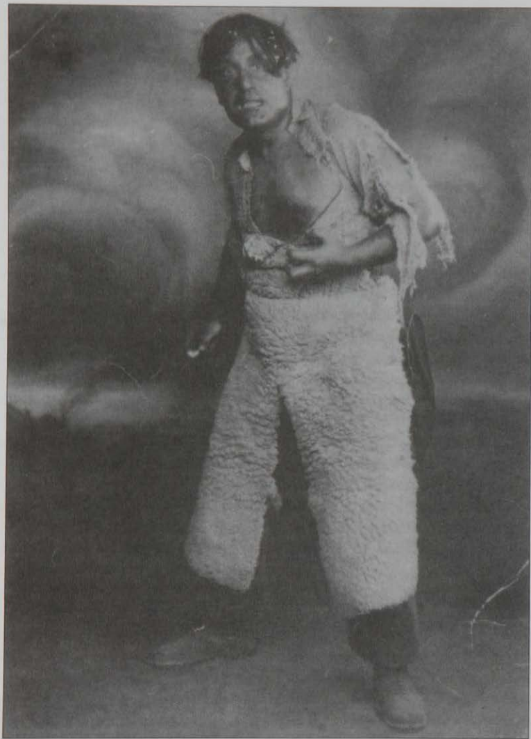
"La isla de las perlas", su partitura más heroica. (Madrid, Teatro Coliseum, 7-3-1933).