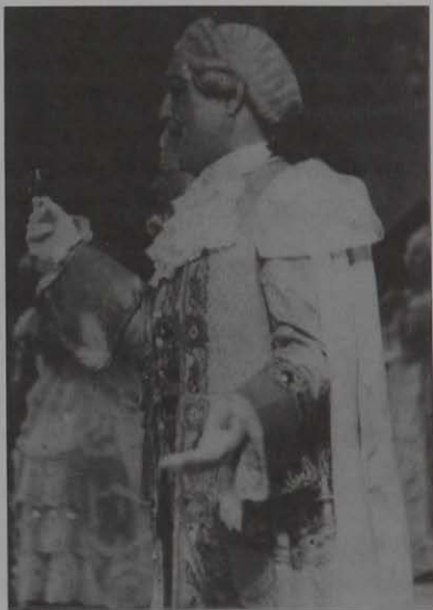
Brindis en "La Traviata", (vestuario poco adecuado)