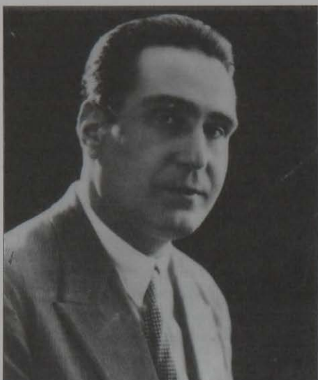
Adolfo Sirvent en Hispanoamérica (1939).