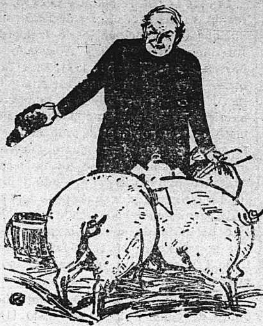
EL «CIELO» DEL CURA

No devolvamos los originales, ni sostenemos correspondencia acerca de ellos. Para su inserción nos atenemos exclusivamente a la calidad de los escritos y a las exigencias de la confección de este periódico.