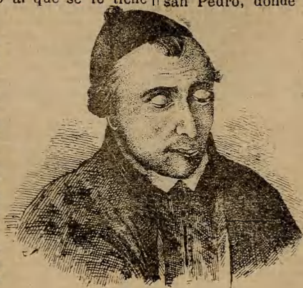
EL VENERABLE MOSEN GREGORIO RIDAURA

Su muerte acaecida en Valencia en 1704 fué muy sentida por sus muchas virtudes y el Arzobispo y Cabildo metropolitano costearon unas suntuosas ex-