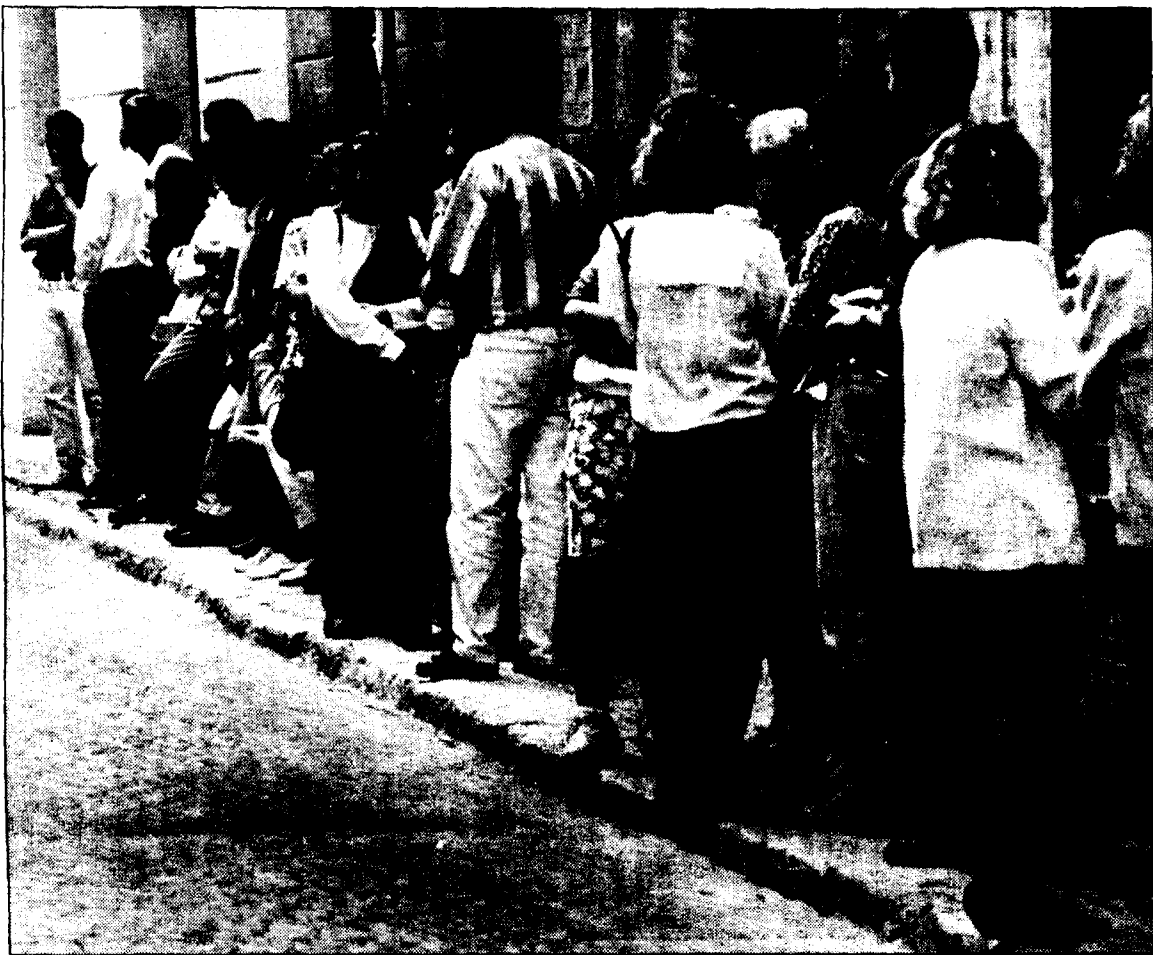
Una de las clásicas colas que se forman cuando hay ejercicios para las oposiciones

En el caso del Ayuntamiento de Ibi los derechos de examen suelen ser de mil pesetas, aunque para las oposiciones de grupo A -titulados superiores- pueden cobrarse dos mil pesetas. Tampoco hay distinciones por la condición laboral del opositor pagando todos por igual. Sin embargo, fuentes de este ayuntamiento indicaron que las fotocopias a compulsar se cobran a doscientas pesetas -las más ca-